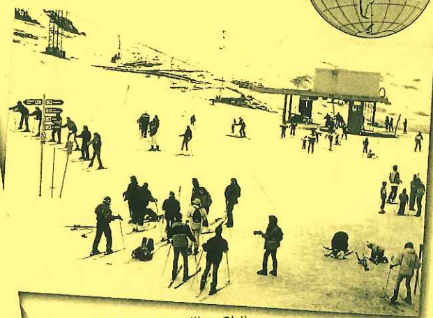
Esquiadores en Portillo, Chile